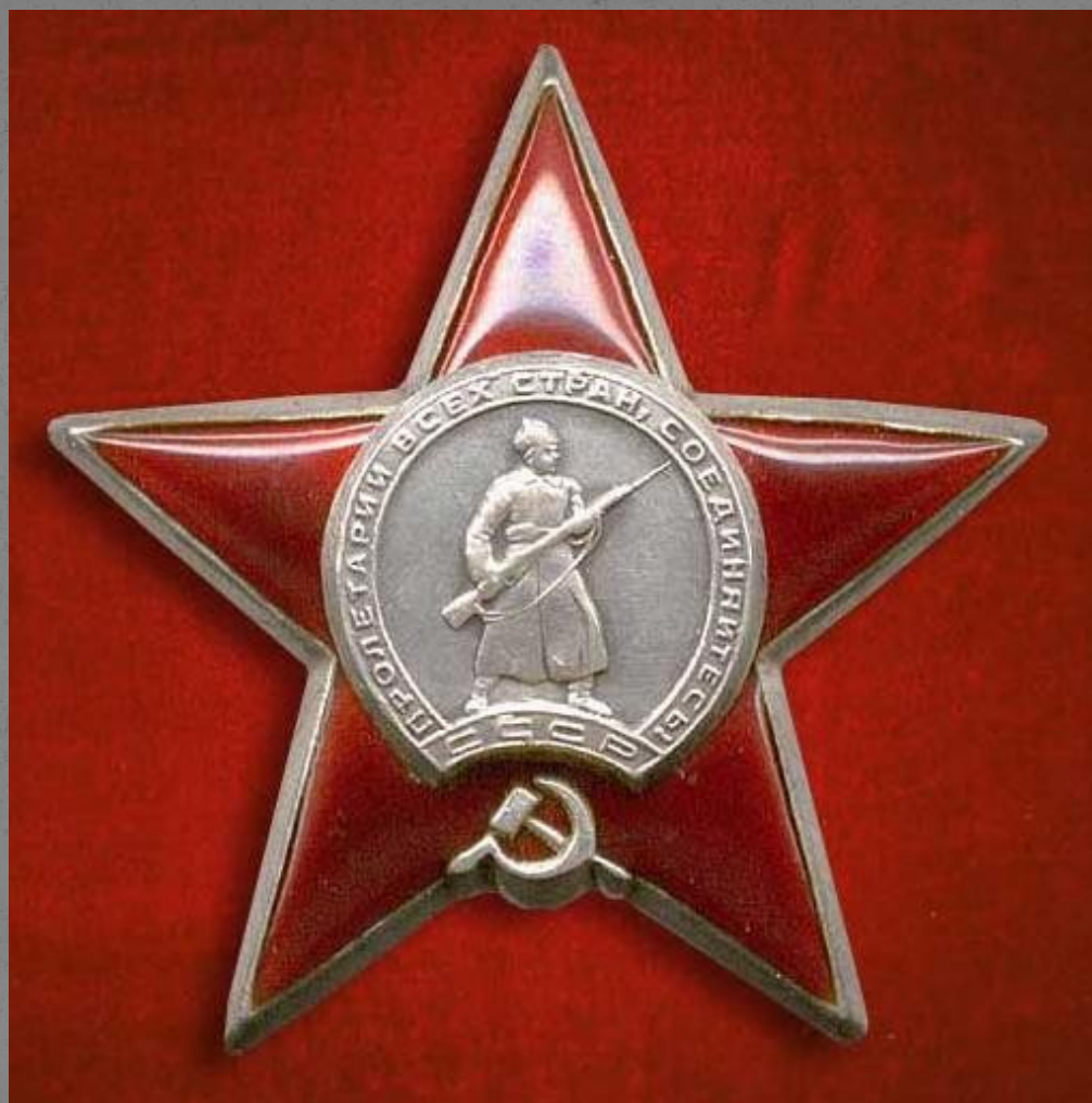
Орден Красной Звезды.

За 25 раненых - ... орденом Красной Звезды.